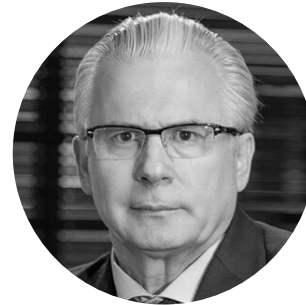
Baltasar Garzón Real

MESA REDONDA: Dónde están los límites al acceso a la información.